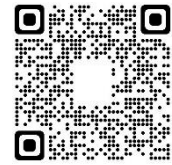
QR CODE : รายงานการประชุม สำนักงานปศุสัตว์จังหวัดอำนาจเจริญ

ฝ่ายบริหารทั่วไป ได้จัดทำรายงานการประชุมครั้งที่ 8/2566 เมื่อวันที่ 31 สิงหาคม พ.ศ. 2566 แล้ว ขอให้ตรวจสอบรายงานการประชุมตาม QR CODE ด้านข้าง หากท่านใดมีความประสงค์จะแก้ไข ขอให้แจ้งต่อที่ประชุม หากไม่มีการแก้ไข ขอมติที่ประชุมให้รับรองรายงานการประชุม